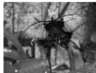
Léto - fotografie Karolíny Soukupové z fotokroužku při naší ZŠ.