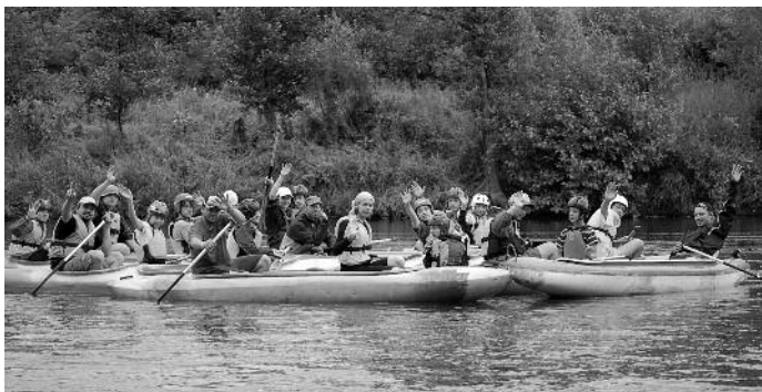
Tábourníci na Ohři o loňských prázdninách.